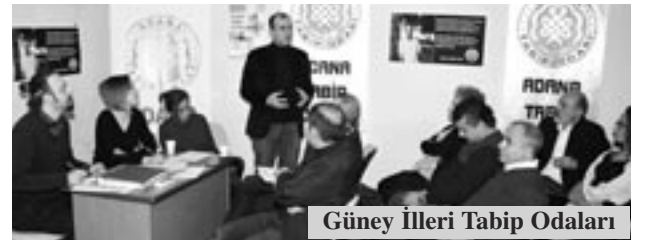
Güney İlleri Tabip Odaları