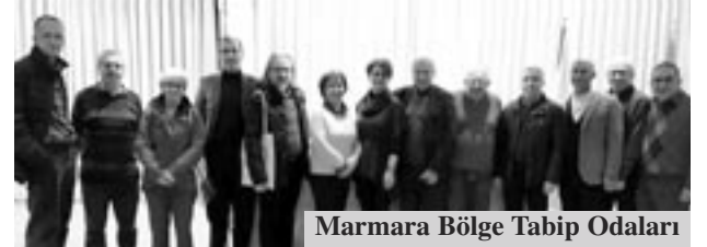
Marmara Bölge Tabip Odaları