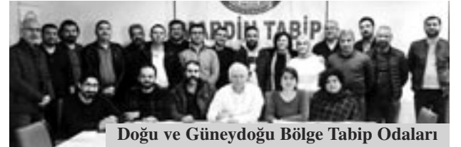
Doğu ve Güneydoğu Bölge Tabip Odaları