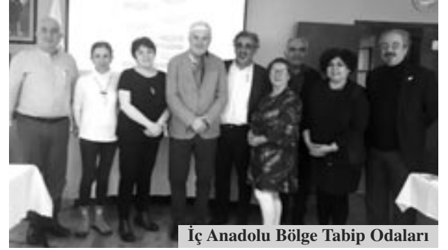
İç Anadolu Bölge Tabip Odaları