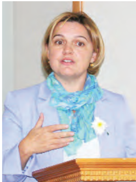
Doç. Dr. Selin Sayek Böke