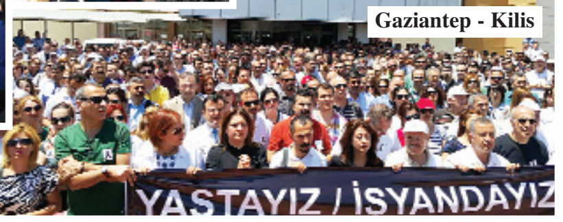
Gaziantep - Kilis