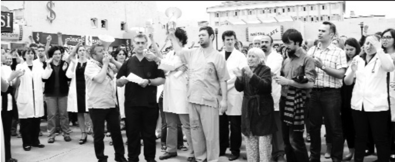
Ankara'da İbn-i Sina Hastanesi bahçesinde toplanan hekim ve sağlık çalışanları, Kızılay'da gerçekleştirilen gösterilerde yaralanan vatandaşlara yardım etmek isteyen sağlıkçılara yönelik polis şiddetini kınadı.